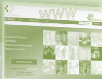
Portal del Ciudadano