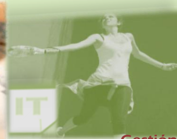
Gestión Incapacidad Temporal