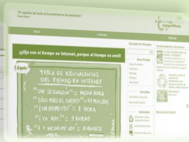
Gestión de Contenidos. Portales